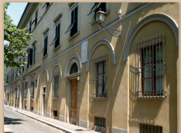
Kunsthistorisches Institut in Florenz