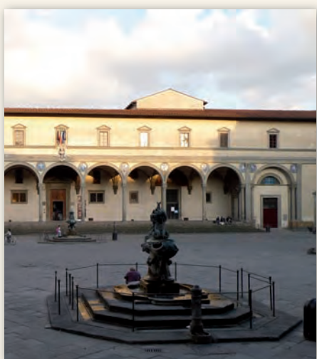
„Ospedale degli Innocenti“

Borgo Pinti, 27 50121 Firenze - Italia Tel. +39 055 2479751 Fax +39 055 2479755 E-mail: info@monnalisa.it Homepage: www.monnalisa.it