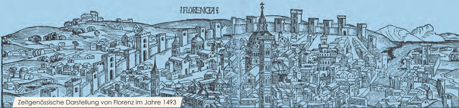
Zeitgenössische Darstellung von Florenz im Jahre 1493